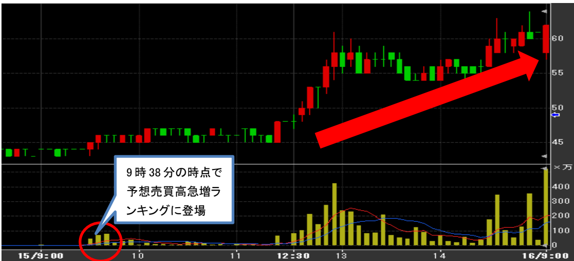
(2015年4月15日 メガネスーパー(3318)の5分足チャート)

※予想売買高急増ランキングの銘柄設定条件は、過去5営業日の平均売買高との比較かつ売買代金1億円以上としております。